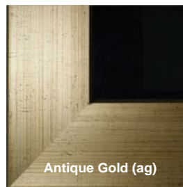
Antique Gold (ag)

Opzione disponibile schermo intero solo per modello da 17"