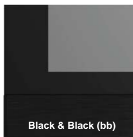
Black & Black (bb)