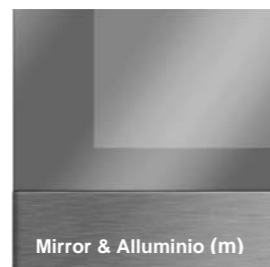
Mirror & Alluminio (m)

Opzione disponibile schermo intero solo per modello da 17"