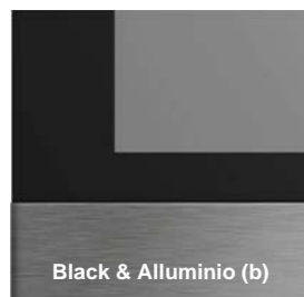
Black & Alluminio (b)

Finiture standard e profili (disponibili nei modelli 7" & 17")