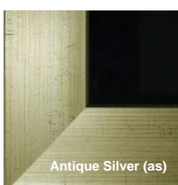
Antique Silver (as)